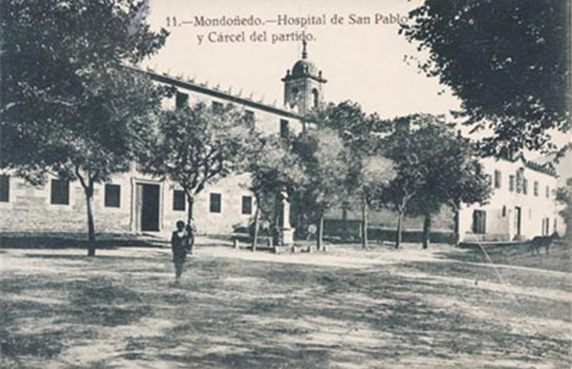
11.—Mondoñedo.—Hospital de San Pablo y Cárcel del partido.